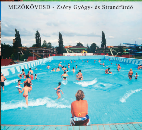
MEZŐKÖVESD - Zsóry Gyógy- és Strandfürdő