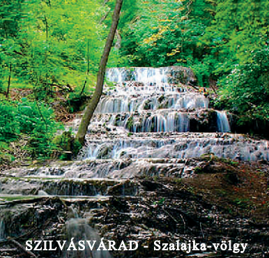
SZILVÁSVARAD - Szalajka-völgy