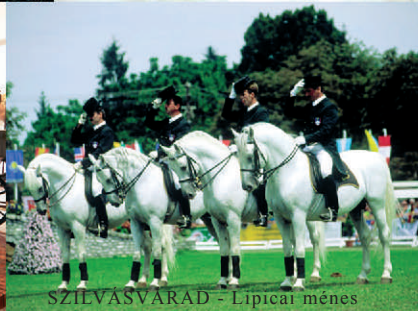
SZILVÁSVARAD - Lipicai ménes