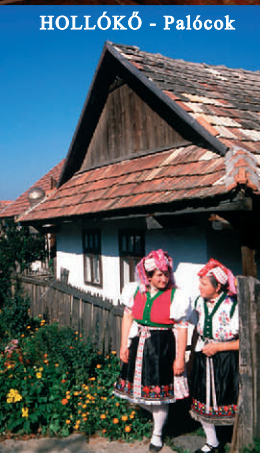
HOLLÓKŐ - Palócok