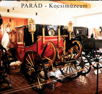
PARÁD - Kocsimúzeum